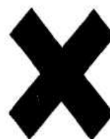
Вещество, опасное для здоровья